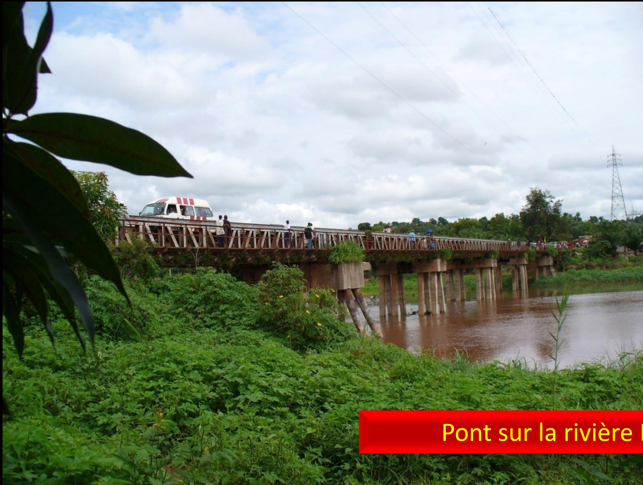
Pont sur la rivière Lukuga