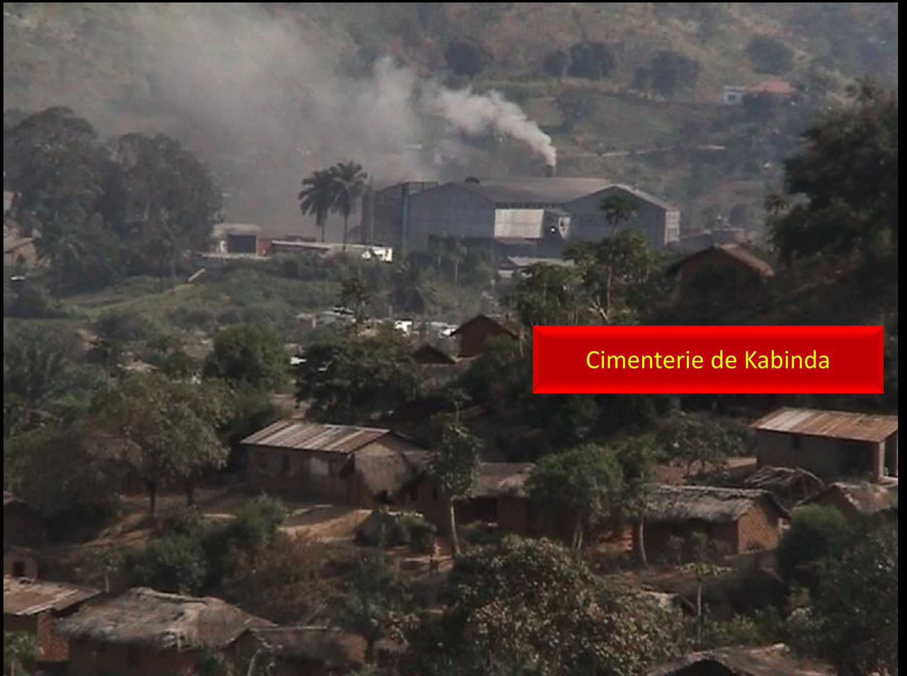
Cimenterie de Kabinda