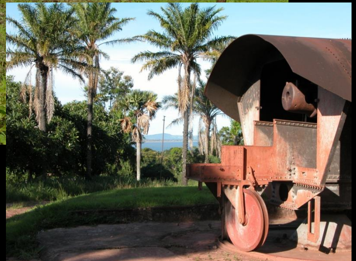
Les canons Krupp